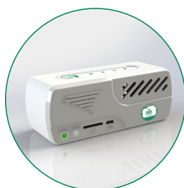
SENSORE AIR IMAGE