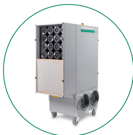
BOX MOLECOLARE 2X32 PZ CAMCARB CG 1300 INCLUSI 2 TELAI (SENZA FILTRO), 2 PZ PER UNITÀ