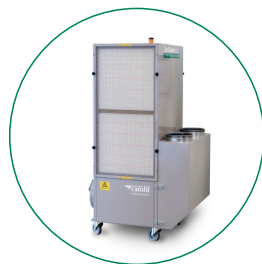
SILENZIATORE (SOLO PER MODELLO VERTICALE), 1-2 PZ PER UNITÀ