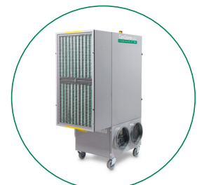
TELAIO DI ESTENSIONE PER FILTRI A TASCHE MORBIDE / CITYCARB / CITY-FLO 592X592X MAX 370 (SENZA FILTRO)