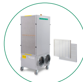
UPGRADE CON PREFILTRO ECOPLEAT DA 97 MM